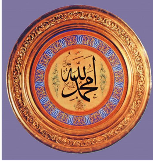
Resim 2: Sultan Abdülmecid'in imzasını taşıyan kitabeli tabak (Türk İslam Eserleri Müzesi, Envanter nr. 139)