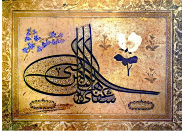
Resim 3: III. Ahmed'in Tuğra şeklinde bir levhası